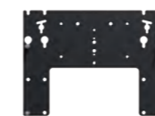
Loewe wall mount slim 432