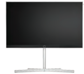
Loewe floor stand motor stellar