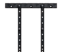
Loewe wall mount universal