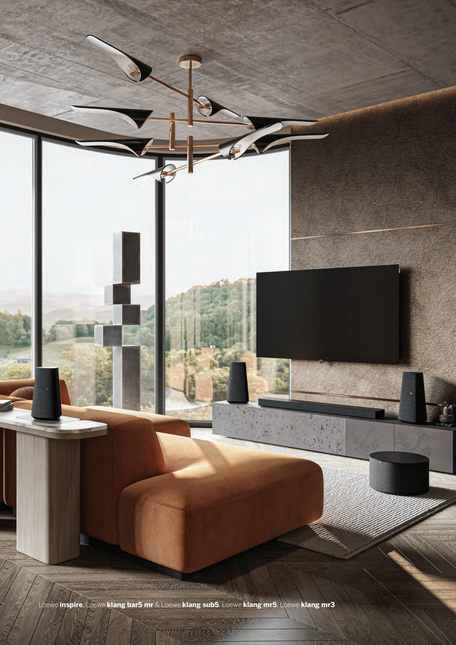
Loewe inspire , Loewe klang bar5 mr & Loewe klang sub5 , Loewe klang mr5 , Loewe klang mr3