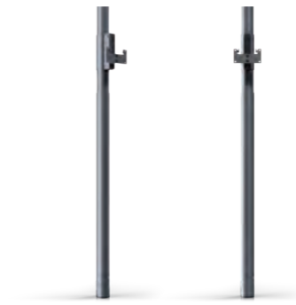
Loewe floor2ceiling stand