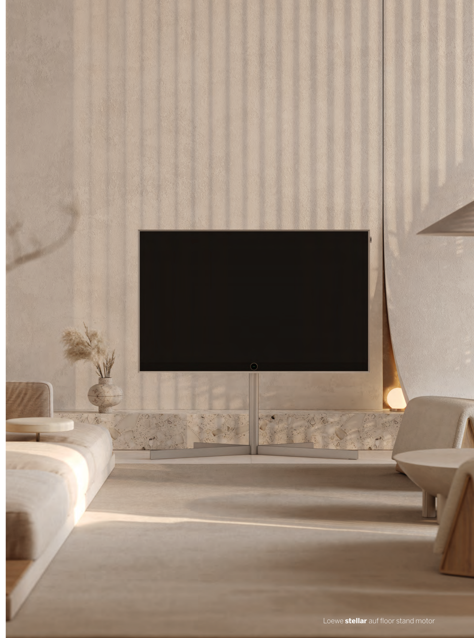
Loewe stellar auf floor stand motor