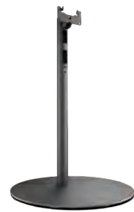
Loewe floor stand universal