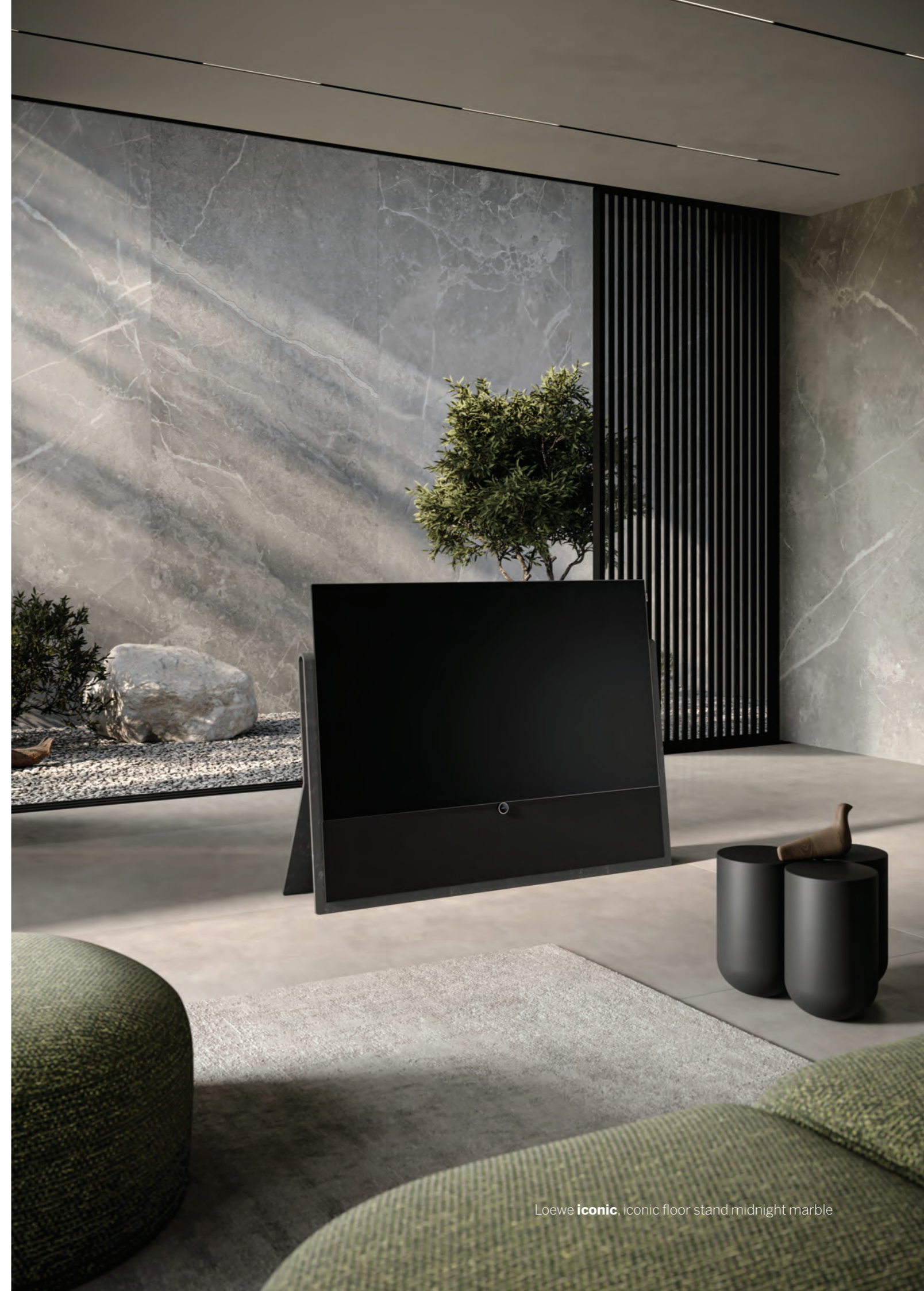
Loewe iconic , iconic floor stand midnight marble