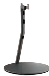
Loewe floor stand flex